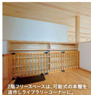
2階フリースペースは、可動式の本棚を造作しライブラリーコーナーに。