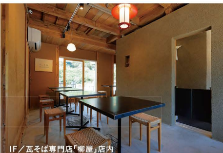
1F/瓦そば専門店「柳屋」店内

長 門湯本温泉は、4年をかけて大規模に街をリノベーション。2020年春に公衆浴場「恩湯」の建て替え、星野リゾート「界長門」の新規オープンを迎え、「オント天国」をコンセプトに、川沿いをそぞろ歩きできる温泉街として生まれ変わりました。 温泉街の中心を流れる音信川は、春の桜、梅雨の虫、夏の川遊び、秋の紅葉、冬のイベント「うたあかり」、365日の照明プロジェクトによる夜間景観など、四季折々の表情豊かな風景を愉しむことができます。 この4年の間に「cafe&pottery 音」