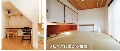
リビングに繋がる和室。