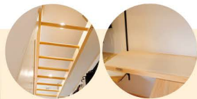
お気に入りの寝室は、圧迫感がないようウォークインクローゼットをオープンにしパーテーション程度の壁を設置。運動不足解消にうんていも造作し、折り畳み式のアイロン台もつけてもらいました。