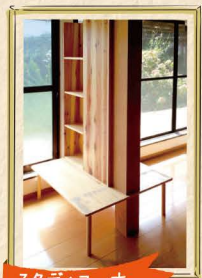
スタディコーナー