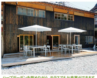
ハーブガーデンを眺めながら、テラスでもお食事ができます。