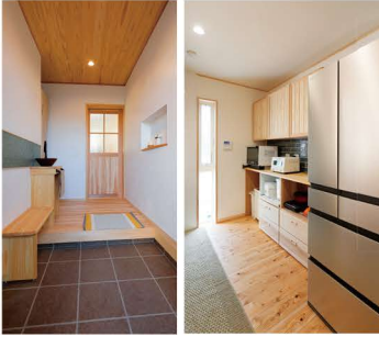
玄関には素敵なおモザイクタイルの手洗いコーナー。 キッチンの雰囲気に合わせて食器棚を造作。