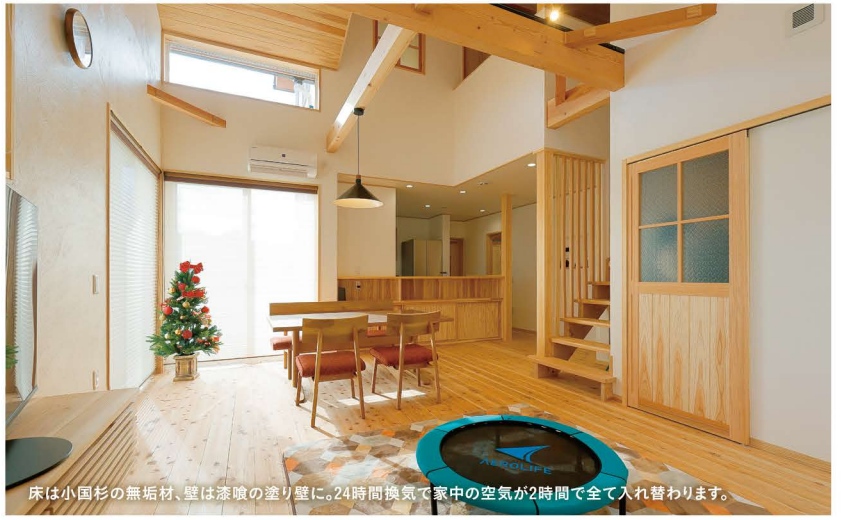
床は小国杉の無垢材、壁は漆喰の塗り壁に。24時間換気で家中の空気が2時間で全て入れ替わります。