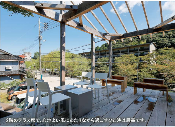
2階のテラス席で、心地よい風にあたりながら過ごすひとは最高です。