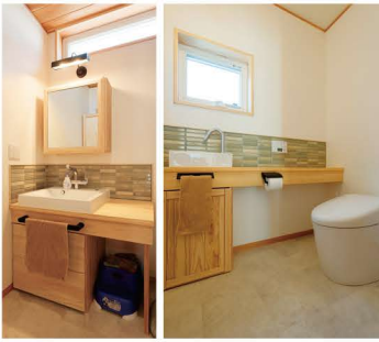
手洗いコーナーのタイルがお洒落。カウンターや収納は造作しています。