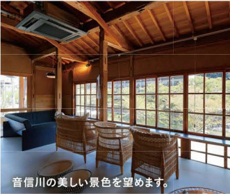
音信川の美しい景色を望めます。