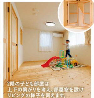
2階の子ども部屋は上下の繋がりを考え、部屋窓を設けリビングの様子を伺えます。