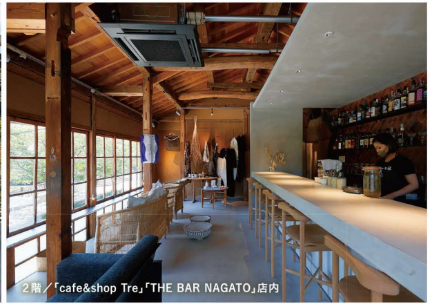
2階/「cafe&shop Tre」「THE BAR NAGATO」店内