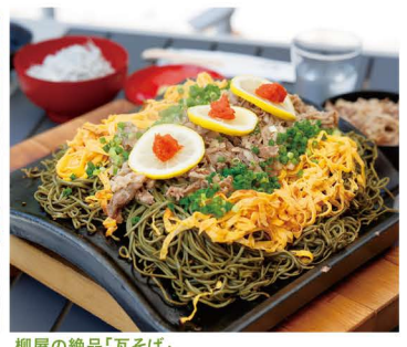
柳屋の絶品「瓦そば」。