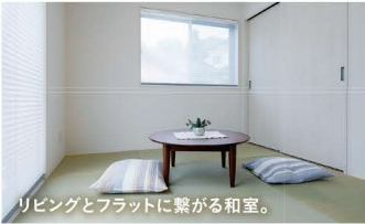
リビングとフラットに繋がる和室。