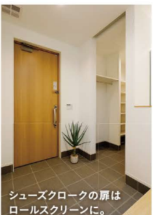
シューズクロークの扉は ロールスクリーンに。

先 輩の新築へ遊びに行ったことがきっかけで家づくりを考え始めたKさんご夫婦。「寒い冬でも暖かく過ごせる家が欲しい」という思いはあったものの、家づくりに関する知識はほぼゼロだったといいます。そんな中、エコビルドさんの家づくり勉強会に参加。高断熱・高气密住宅を知り、さっそくモデルハウス見学を申し込むことに。「12月でもリビングのエアコン1台で暖房が十分なことに驚きました。家もオシャレで間取りも無駄がなく気に入りました。」ご主人。