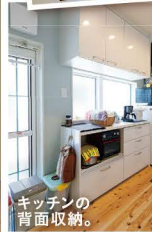
キッチンの 背面収納。

My Favorites 素敵なステンド ガラスの扉は オーダーしたもの 奥さま一番の お気に入り