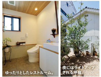
ゆったりとしたレストルーム。