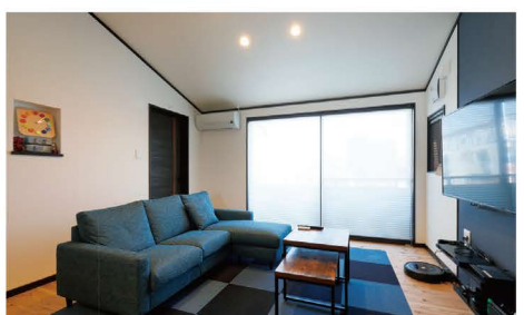
壁掛けテレビにすることで、空間を広く使えます。