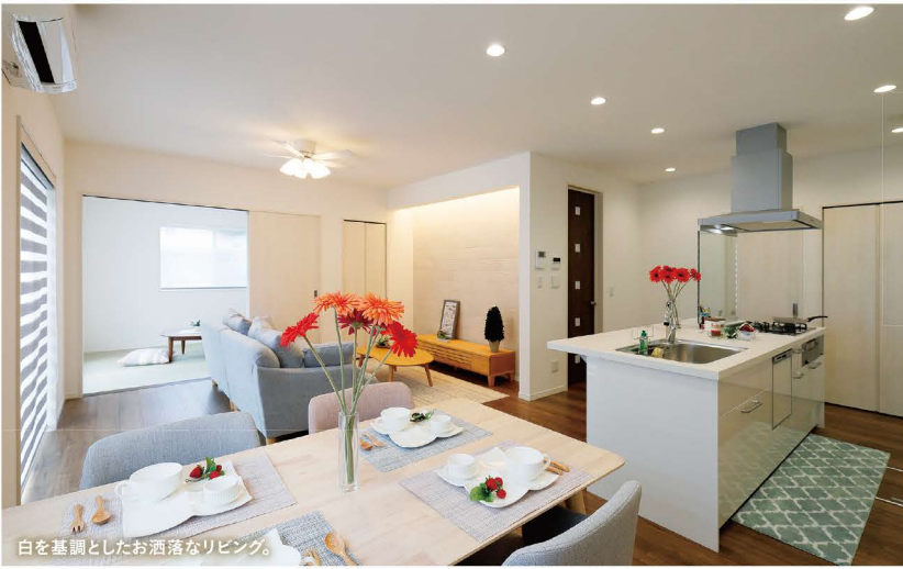
白を基調としたお洒落なリビング。