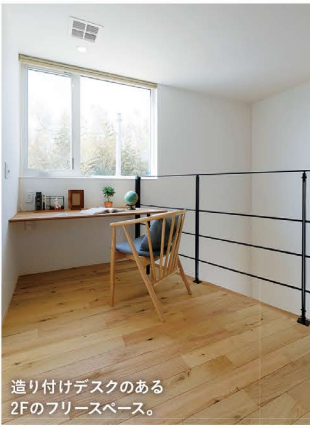
造り付けデスクのある 2Fのフリースペース。