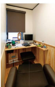
作り付けの机を造作したご主人こだわりの書斎。