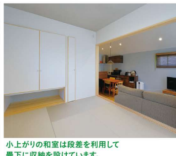
小上がりの和室は段差を利用して畳下に収納を設けています。