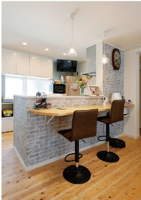
お洒落なペンダントライトに照らされたカウンターでは、ご夫婦でお食事をしたり、ティータイムなどゆっくりとした時間が流れます。キッチンカウンター専用のテレビもあります。