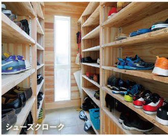
シューズクローク