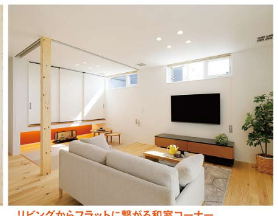
リビングからフラットに繋がる和室コーナー。