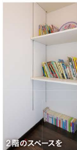
2階のスペースを活かした本棚。