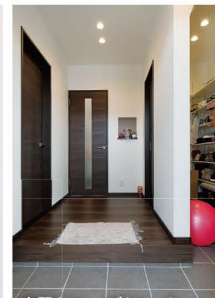
玄関&シューズクローク