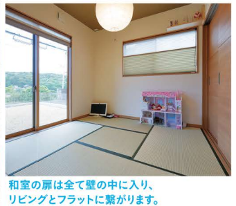
和室の扉は全て壁の中に入り、リビングとフラットに繋がります。遊びに来るご友人の客間として利用できます。