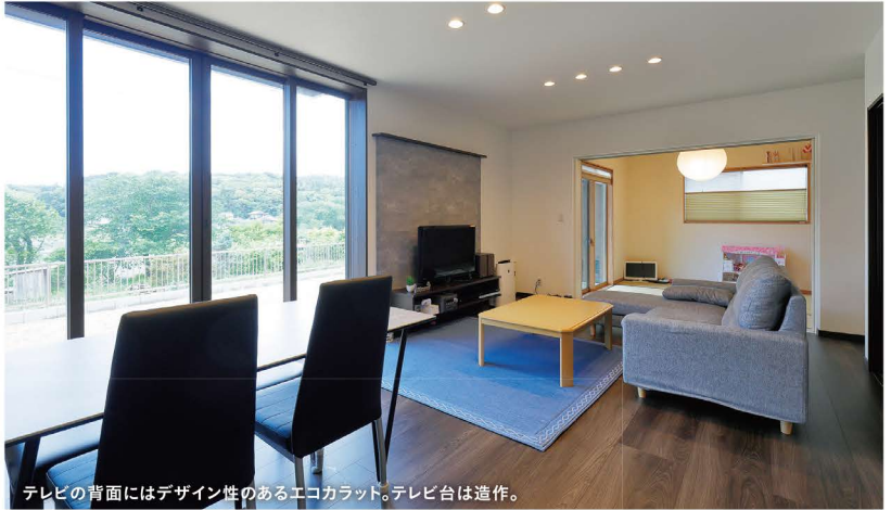
テレビの背面にはデザイン性のあるエコカラット。テレビ台は造作。

「人が通ることがないので、いつも開けた感じにしています」と奥さまが言うくらい、自然に囲まれたプライベートな空間。