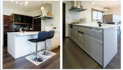
食器棚はデザイン・サイズもびったりなものをセレクト。

リビングにあるキッズコーナー。将来はお子さまのスタディスペースや奥さまの家事室としても使えます。