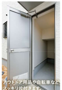
アウトドア用品や自転車などススキリ片付きます。