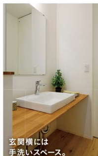
玄関横には 手洗いスペース。