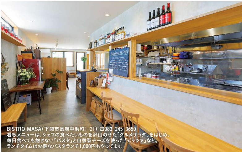
BISTRO MASA(下関市長府中浜町1-21) ☎083-245-3650 看板メニューは、シェフの食べたいものを沢山のせた「クルメサラダ」をはじめ、毎日食べても飽きない「パスタ」と自家製チーズを使った「ピッツァ」など。ランチタイムはお得なバスタランチ1,000円もやっています。