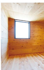
大容量の小屋裏収納は、必要な時にだけ引き降ろして使える収納はしごを使用。