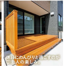
休日のにんびりと過ごすのが ご主人の楽しみ。