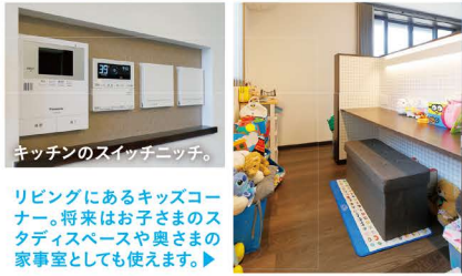
キッチンのスイッチニッチ。

リビングにあるキッズコーナー。将来はお子さまのスタディスペースや奥さまの家事室としても使えます。