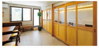
店内はカウンター席、ボックス席、扉で仕切れる個室と様々なシチュエーションに対応できる作りになっています。