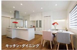
キッチン・ダイニング