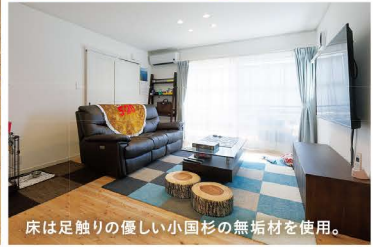
床は足触りの優しい小国杉の無垢材を使用。