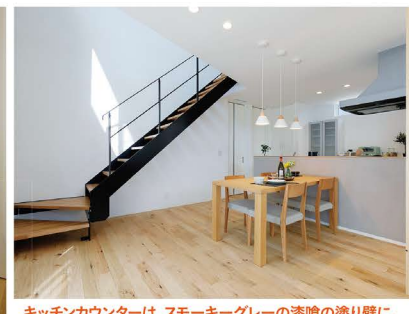
キッチンカウンターは、スモーキーグレーの漆喰の塗り壁に。