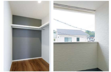
寝室にはウォークインクローゼットと、インナーバルコニー。