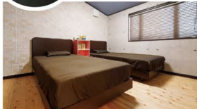
寝室はコンクリート打ちっばなし風のクロスでカッコいい空間。