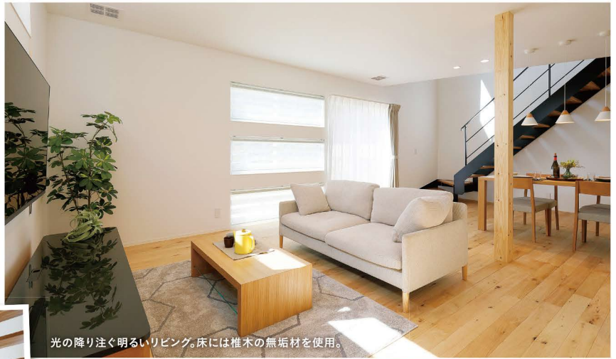
光の降り注ぐ明るいリビング。床には椎木の無垢材を使用。