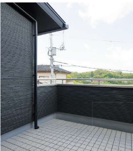
広々としたバルコニー。

「2階には寝室と子ども部屋、ご主人念願の書斎もあります。書斎は3帖の空間を有意義に使った男性憧れの空間です。」