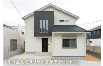
3つ並んだスリット窓がアクセントに。