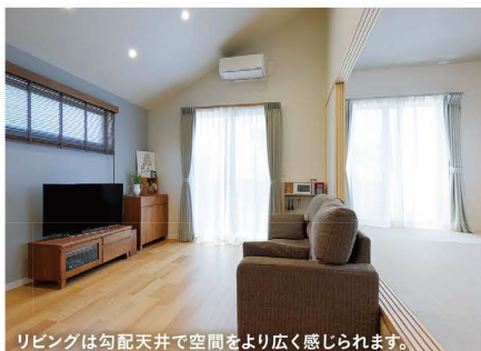
リビングは勾配天井で空間をより広く感じられます。