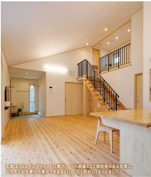
玄関はリビングにダイレクトに繋げ、一つの部屋として開放感のある空間に。ご主人がお仕事の作業ができるようにと、広く設計してもらいました。