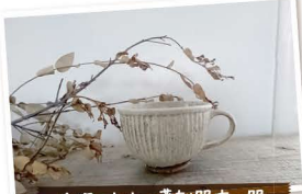
秋月 木木の雑貨器店の器

豊田町道の駅近くにある、白くて可愛い小屋風の建物「ことり農園」です。体に優しい無農薬の野菜と、オーナーが独自でセレクトした雑貨や、ハンドメイド作品・オリジナルデザインのサンエやリネンウオーターなど、お家を彩り日々心地よく暮らせるようなものが取り揃えてあります。 野菜やイチゴをお店の外で栽培し、低農薬のお米も育てているそう。季節ごとに変わるのかな風景にとても癒やされます。 休日にはちよと豊田町までドライブして、豊かな自然に囲まれたスローな時間を過ごしませんか？