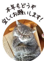
「本日もどうぞ宜しくお願いします!」

「ココチ」冬号の到着です。ちよっとリニューアルした「ココチ」をお楽しみいただけましたか? 日々の暮らしが少しでも楽しくなるようお手伝いできれば嬉しいです。 このたび「ココチ」ホームページもはじめました。ちよっとした空き時間にでものぞいてくださいませ。心温まる1冊になりますように。