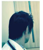
今回の男レシビ 医療関係従事 Rさん