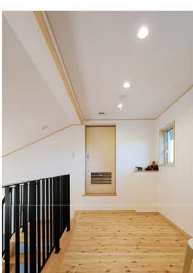
階段上のフリースペース。