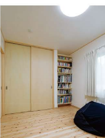
奥さまのお気に入りの寝室。