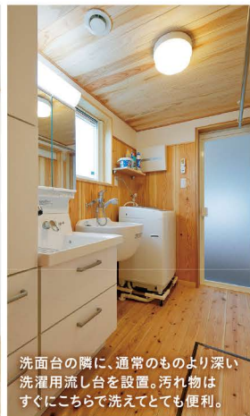
洗面台の隣に、通常のものより深い洗濯用流し台を設置。汚れ物はすぐにこちらで洗えてとても便利。