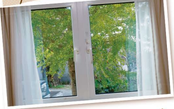
奥さまお気に入りの寝室の両開きの窓の大きな銀杏の木を眺めると癒やされるそうよ