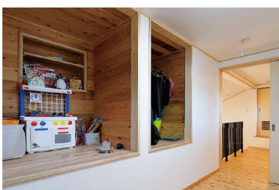
自由に使える子ども部屋。ご主人の仕事道具もこちらに収納。