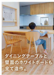
ダイニングテーブルと壁面のホワイトボードも全て造作。