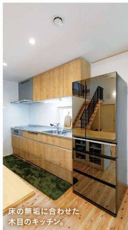
床の無垢に合わせた木目のキッチン。