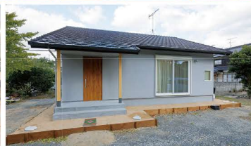
スモークグレーの外観。海の近くなので屋根には塩害に強い石州瓦を使っています。