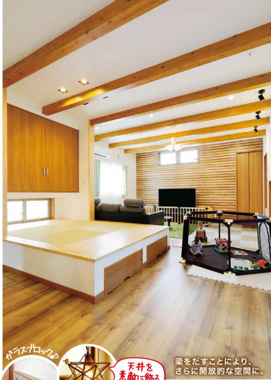
梁をだすことにより、さらに開放的な空間に。