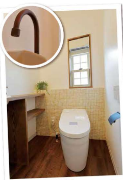
細部まで可愛いトイレ