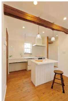
キッチンには古材の飾り梁が

そして気付いたのが、「ここは空気が違 う」ということ。自然素材、漆喰の壁に包ま れた家って空気がこんなに違うんですね。 キッチンも真っ白な壁のタイルが素敵で、 オリジナルのカウンターも白いタイルがと ても可愛いです。「男性の方はなぜかこのタ イルのカウンター横の丸椅子によ く腰かけられてゆっくりされるんで すよ。」と下関ハウジングのSさん。 このカウンターでお子様と一緒に料 理の準備をしたり、夜はゆっくりお 酒をたしなんだりお使い勝手もい いですね。テーブルに座って吹抜け を見上げたら、真っ白な壁と趣のあ る照明が教会を連想させます。