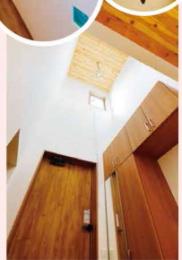
吹抜け空間の玄関。