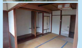
リフォーム前は室内も暗く 汚れが目立つ外観。