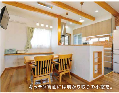
キッチン背面には明かり取りの小窓を。