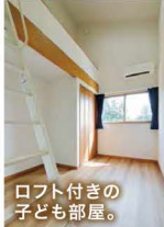
ロフト付きの子ども部屋。