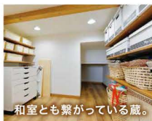
和室とも繋がっている蔵。

の形を活かしたプライベートスペース。L字のデッキでいつかBBQをしたいと旦那さま。キッチンはお手入れのしやすさを考慮したタイル調のクッションフロア。作り付けのスパイスラックやマガジンラックはソウフさんにお任せのデザイン。また、奥さま念願の大収納「蔵」もあります。この上が2階のスキップフロアで、ご家族のセカンドリビングです。