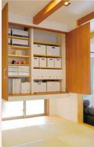
小上がりの畳の大収納。

扉を開くと、みんな驚く素敵な空間。吹抜けを見上げ、カラフルなガラスブロックとボラリスに目を奪われます。入ってすぐ左の黒い格子の扉が和室。アールに描かれた、垂れ壁の床の間。お月さまのような丸窓は、しっとり落ち着いた旅館のよう。