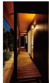
減築して作った 長いウッドデッキの 夜の灯りも素敵です。