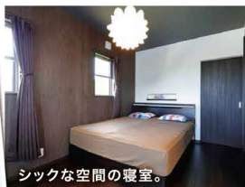
シックな空間の寝室。

2階の子ども部屋は秘密基地のよう。勾配天井を活かしたはじごのロフトは、お子さまの格好の遊び場になりそう。これからは楽しみですね。黒い扉は寝室。1日の疲れを癒す落ち着いた霧囲気に。