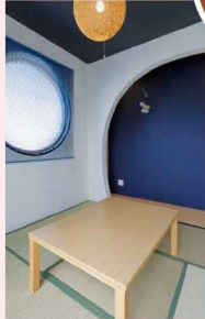
紺で統一された和室。