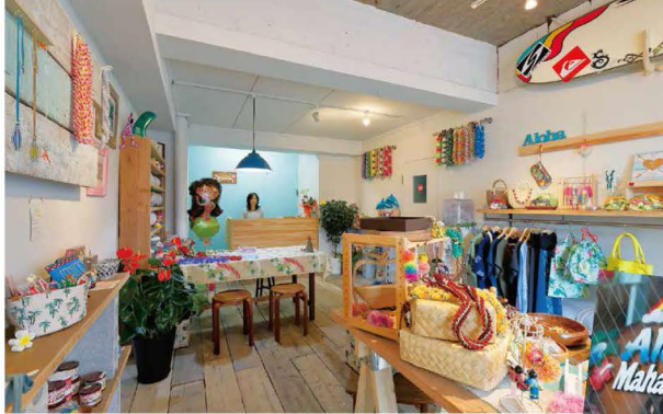
リノベ部がペイントした壁面に、ご主人愛用のサーフボードをディスプレイ!

malaloha (阿弥陀寺町8-8) ☎083-242-1478 営/10時~17時(火水休)