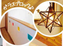
天井を素敵に飾るボラリス