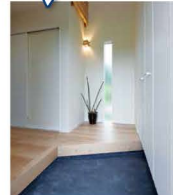
濃紺の土間の玄関