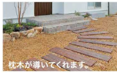
枕木が導いてくれます。

ど んな風になるんだろうと、とても 楽しみに待ってました。ずっと気 になっていた道路沿いに並ぶ4棟 のアンティークな可愛らしいお家。真っ白い BOX：いよいよ完成したと聞き念願の シャベトル青山を訪れました。 自然石のアプローチで 覆われた敷地の中は、ま るでフランスの片田舎を 訪れたよう。こっだけ ほっこりした異空間で す。「ラシック」とネーミ ングされたお家はフラン ス語で「自分らしくお洒 落で粋な暮らし」とい