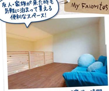
広々としたロフトスペースで寛ぎの時間