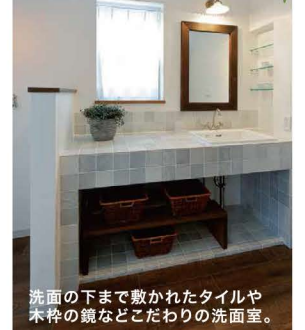
洗面の下まで敷かれたタイルや 木枠の鏡などこだわりの洗面室。