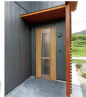
スタイリッシュな玄関扉