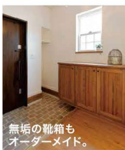
無垢の靴箱も オーダーメイド。

泡ガラスが味のあるオリ リビングに繋がるドアも はどうなってるんだろー！ はどっさり可愛かったら中 だけてこんなに可愛かったら中 む柔らかかな光アンティークな照明。玄関だけ シースボックス、格子の小さな窓から差し込 る柔らかかな光アンティークな照明。玄関だけ