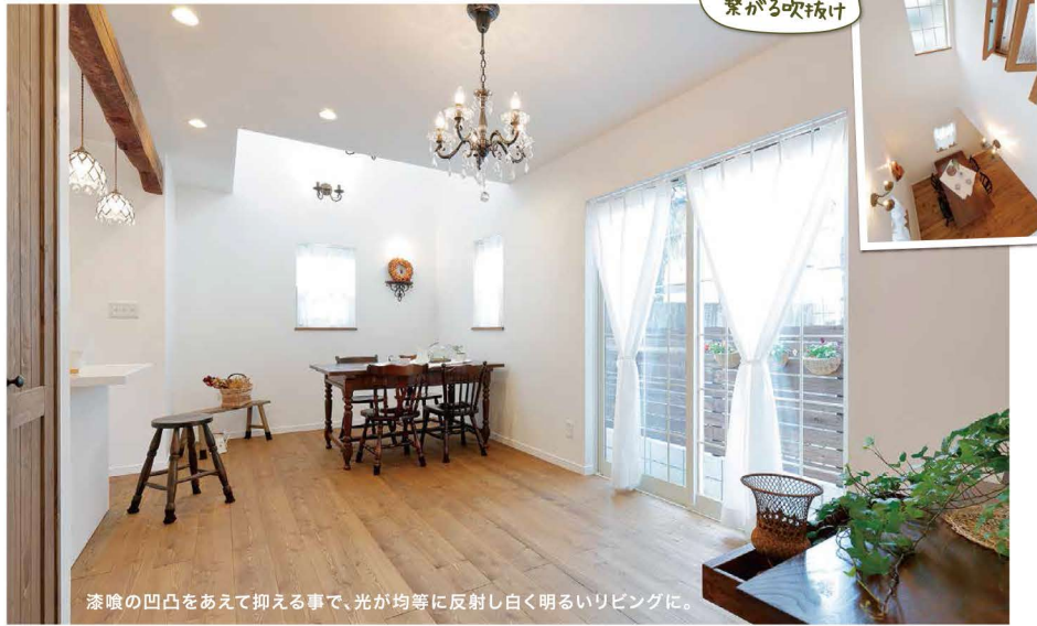
漆喰の凹凸をあえて抑える事で、光が均等に反射し白く明るいリビングに。

泡ガラスが味のあるオリ リビングに繋がるドアも はどうなってるんだろー！ はどっさり可愛かったら中 だけてこんなに可愛かったら中 む柔らかかな光アンティークな照明。玄関だけ シースボックス、格子の小さな窓から差し込 る柔らかかな光アンティークな照明。玄関だけ