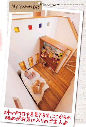
スキップフロアを見下ろす、ここからの眺めがお気に入りのご主人