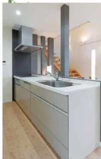
部屋のトーンに合わせた 濃いグレーの男キッチン。

LDKはたくさんの友人を呼んで男料理を振るまったり、お酒を飲んだり自分の好きなインテリアに囲まれた自分だけの城。リビングの奥は先のことを見据え2つのお部屋とウォークインクローゼット。広めにとったランドリースペースは、洗濯物もここにまとめて干すことができます。