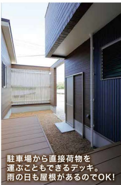
駐車場から直接荷物を運ぶこともできるテッキ。雨の日も屋根があるのでOK!

LDKは、広々25帖。ちょうど真ん中の小上がりの畳スペースにより、1つの空間の中でリビングとダイニングに分けています。リビングは木目調、ダイニングはレンガ調と二面だけクロスを変えるのも面白いですね。