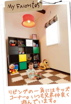
リビングの一角にはキッズコーナー。いつも兄弟仲良く遊んでいます。