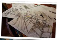
手書きのラフや設計図。お見事です!▶

ルされました。全国各地から旬の食材を取り寄せ、野菜中心の各地の郷土料理をオリジナルの味で楽しませてくれます。ひとりひとりのお客様に合わせて考えられたシエフこだわりの料理は、何度行っても新鮮な喜びを与えてくれます。