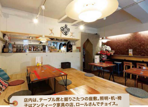
店内は、テーブル席と掘りごたつの座敷。照明・机・椅子はアンティーク家具の店、ロールさんでチョイス。