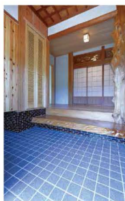
青いタイルが爽やかな広い玄関。

今回は築32年の和風住宅リフォーム。期待に胸を膨らませながら道を進んでいくと、立派な石垣に囲まれた瓦屋根のお家があります。