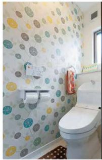
水玉の壁紙がアクセントの可愛いらしいトイレ。

の向こうにはランドリースペース兼ストックヤード。さらに家事時間を短縮できますね。全てを見渡せる対面キッチンは、お子さまの様子も家事をしながら見ることもできます。