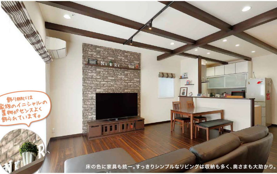
床の色に家具も統一。すっきりシンプルなりビングは収納も多く、奥さまも大助かり。