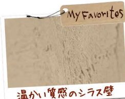
My Favorites 温かい質感のシラス壁

れたシラス壁で塗られています。迷う事も多く、工程が進んでいる途中での変更をお願いしましたが、神谷工務店さんは快く応じてくれました。自社の大工さんが来られる安心感もありましたね。」と奥さま。