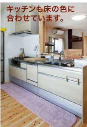
キッチンも床の色に合わせています。

撮影後、奥さまが淹れてくれた美味しい珈琲と自然なものに囲まれ、ゆったりとした時間を過ごすことができ、心と体に元気をもらった1日でした。