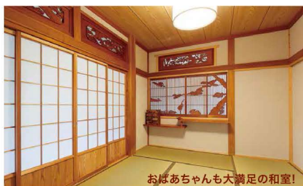
おばあちゃんも大満足の和室！

なりました。通気欄間も取り付ける事で風通りが良くなり、撮影当日も気持ちの良いそよ風が。トカゲちゃん達も気持ちが良いそうです。またリビングには、奥さま待望の薪ストーブもあり、お部屋のいいアクセントになっています。「冬が楽しみですわ」とお話しすると「7月には使っちゃうかも笑」とユニークな奥さま。