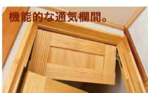
機能的な通気欄間。

「お邪魔しますー」玄関で奥さまが笑顔で出迎えてくださいました。扉を開けると、とても広い玄関に思わずびっくり！今では手に入りづらい檜と紫檀と檜の大きな柱が出迎えてくれます。