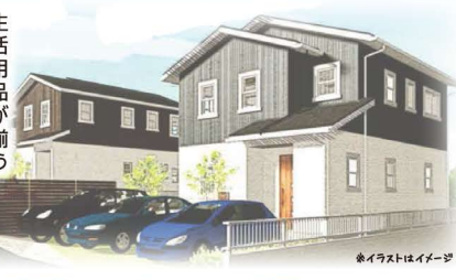
※イラストイメージ

生活用品が揃う ショッピングセンターや 子供達が通う学校にも 近く、大変便利です。