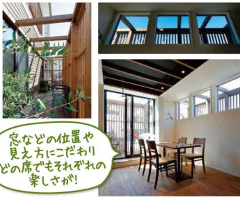
窓などの位置や見え方にこだわりの席でもそれぞれ楽しさがある!