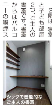
シックで機能的なご主人の書斎。

小さな男の子が2人いるとは思えないくらい、キレイに片付いたT邸。センスよく飾られた玄関は土間収納もあり、お客さまをお迎えするにもふさわしい空間です。入ってすぐに6帖の和室。将来、同居のことも考え独立型にしています。玄関からは、キッチンとリビングに繋がる2つの扉があります。お買い物から帰った奥さまは、そのまま荷物をキッチンへ。お客さまはリビングへ。ぐるっと回れる回遊型動線になっています。広々LDKは約23帖。キッチンを中心に洗面・お風呂と水回りを集めています。また、勝手口