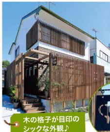
木の格子が目印のシックな外観♪

い つも通る道沿いに次第に出来ていく軽やかな木製格子。どんなお店か気になってたんです。コンセプトは「風の通る、開放的な空間」。ガラリと新しいインテリアデザインは、お昼はゆったりランチタイム、夜はコース料理とお酒を楽しむ落ち着いた空間へリニューアル