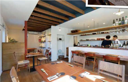
野菜中心の優しいメニュー。炊きたてのご飯で召し上がれ♪ お問合せ:歩来里(ぶらり) ☎083-249-5658 ※予約がおすすめ