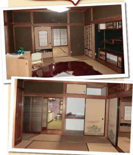
- before -