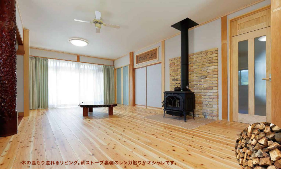
木の温もり溢れるリビング。薪ストーブ裏側のレンガ貼りがオシャレです。