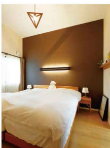
間接照明が素敵な寝室。

スローな時間を感じるH邸。一つ一つが可愛くお洒落で、癒される場所。家族だけでなく、お客様も寛げるお宅でした。このH邸の見学をご希望の方は、建和住宅までお問い合わせください。