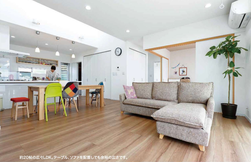
約20帖の広々LDK。テーブル、ソファを配置しても余裕の広さです。