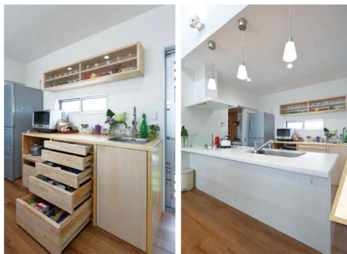
イケア×創和の1点ものの食器棚。とっても使いやすそう♪

LDKは、約20帖。なかでも、2m70cmのアイランドキッチンは、存在感があります。料理のお仕事をしている奥さまのこだわりです！お料理はもちろん、デザートも絶品だそう！ダイニングの上には開放的な吹き抜けもあり、窓からは光が差し込みます。キッチンの壁三面のクローゼットは、コンセントもついでるので電話やPCもすっきり収納できます。また、数々の食材をストック