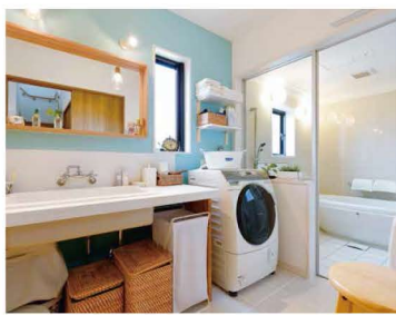
水回りは、ブルーと白で可愛らしく清潔感のある仕上がりに。タイル貼りの造作洗面台やたまご型のお風呂は、リゾートホテルに来たような空間。

もカフェの様に寛いでもらえそう。それでは、2階へ。寝室はあえてコンパクトにし、その分、横長の広々ウォークインを設置(なんと6m!)。「オールシーズン」の服が掛けられるから、衣替えもしなくていいですよ!」と大満足。隣には自分の時間を有意義に過ごせる、ご主人の趣味部屋もあります。