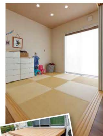
通称「仲田デッキ(笑)」。

LDKに繋がる琉球畳の和室は、扉をオープンにするとリビングとつながります。リビングの大きな窓の外には、なんとも広いデッキが。「我が家では、仲田デッキと呼んでいます。」現場監督さんのことなのですが、名前がつくほど仲が良く、さすがの「ミニ」ケーションです。気兼ねなしに何でも言い合えるのがいいですね。のどかで開放的なN邸。「走り回れるのがいい。」「外で遊べるのがいい。」「ご夫婦。好奇心旺盛な子どもにとって、最高の場所です。これから、すすすくと育っていくのが楽しみですですね！」