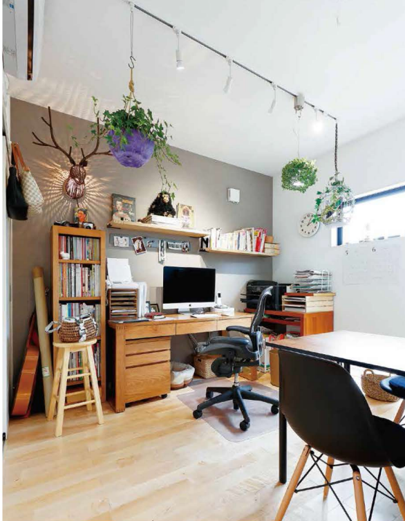
奥さまの仕事部屋。雑誌の撮影用セット?と思わせないかりの素敵な空間。