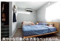
爽やかな印象のお洒落なベッドルーム。

LDKに繋がる琉球畳の和室は、扉をオープンにするとリビングとつながります。リビングの大きな窓の外には、なんとも広いデッキが。「我が家では、仲田デッキと呼んでいます。」現場監督さんのことなのですが、名前がつくほど仲が良く、さすがの「ミニ」ケーションです。気兼ねなしに何でも言い合えるのがいいですね。のどかで開放的なN邸。「走り回れるのがいい。」「外で遊べるのがいい。」「ご夫婦。好奇心旺盛な子どもにとって、最高の場所です。これから、すすすくと育っていくのが楽しみですですね！」