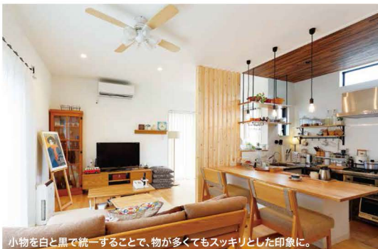
小物を白と黒で統一することで、物が多くてもスッキリとした印象に。

「景色が気に入って土地を決めた。」と云うご夫婦の話しを聞いた設計士さんのアイデア。「一番景色の良い所に、このコーナーを作ってくれたそうです。キッチンには、ステンレスのオーダースィンクにお洒落なガスコンロがある、「コの字型」のオープンキッチン。ソラマドのモデルハウスを見て、ピンと来たそうです。「キッチン側が一段下がっているので、カウンターに座っておしゃべりしても、視線が合うのでいいですよ。」と奥さま。お友達が来て