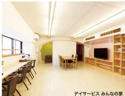
DIYサービス みんなの家

鈴木浩介建築設計事務所+金剛住機 株式会社 〒751-0823 下関市貴船町4-1-23 http://ameblo.jp/yutorio/ http://www.facebook.com/yutorio