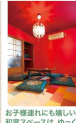
お子様連れにも嬉しい真っ赤な和室スペースは、ゆっくりに寛げます。