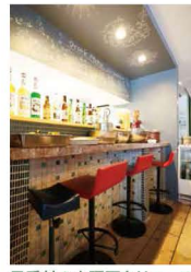
元受付の大理石をリユース。

壁は黒板塗料を塗り、その日のおすすめメニューやイラストが描かれています。今回は、鈴木浩介建築設計事務所とのデザイン、金剛住機(株)の協力・施工指導のもと、予算をかけるに手間暇かけた、ボランテアスタッフによるセルフリノベーションです。