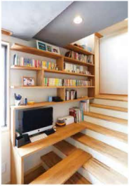
パソコンデスクも階段を利用して作り付けの棚でスッキリ収納。

キッチンには、パン作りが得意な奥さまのお気に入り。「私にはもったいないくらいい」と奥さま。毎朝、焼き立てパンの香りが広がります。昔の増築でできた使いにくい1.3mの段差は、階段の中を上げて、勾配を緩くしり下りしやすくするだけでなく、両側に本棚を作り、座って本を読んだりできる