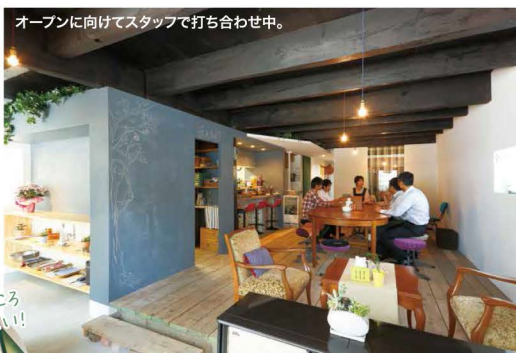
オープンを向けてスタッフで打ち合わせ中。

「明」日は、mimi hana カフェオープンの日着々と準備が進む中、ココチの取材も開始です。