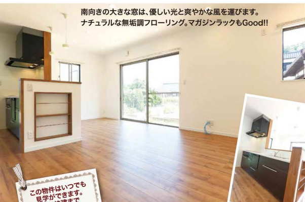
南向きの大きな窓は、優しい光と爽やかな風を運びます。 ナチュラルな無垢調フローリング。マガジンラックもGood!!