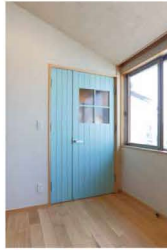
ガラス窓の扉にしたいと、オーダーしました。

「明」日は、mimi hana カフェオープンの日着々と準備が進む中、ココチの取材も開始です。