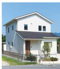
白を基調としたお洒落な外観。

ーカーはもちろんアウトドア用品も十分にしまえます。LDKは17畳。ダウンライトにすることで、天井をすっきり広々。キッチンは、IHヒーターと食器洗い乾燥機付き！対面キッチンでお料理するのめ楽しいかも。また、家事をするための動きと、2階やトイレ。お風呂に行き来するための動きを短く、スムーズにこなせるように考えられた回遊型動線は、これからの家づくりの参考にもしたいですね！