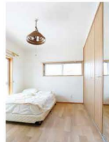
朝の目覚めが良さそうな明るく清潔なベッドルーム。水色のペイントが可愛い!

「うれしいお知らせ!!」この北欧テイストのお家、9月7日(日)に見学会をします。詳しくはお問い合わせください。