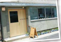
mimi hanaカフェ(月曜定休日) 新地町2-13 ☎083-232-3387

天井を解体して出してきた梁や窓、大黒柱を表しにしたり、中古の杉板を床や天井にリユースしたりと、温故知新なデザインになっています。また、デッドストックのタイルやサンブルの床材を活用するなど、節約アイデアも満載です!もちろん、プロの指導のもとスタッフみんなで壁を塗ったり、タイルを貼ったり。こうして出来上がったmimi hanaカフェ。みんなの寛ぎの場所がまたひとつ増えましたね。