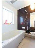
浴槽のまわりにはセルローズファイバーが入っているので保温効果大!!

切ですね! H邸の壁は、すべて光冷暖専用の漆喰の塗り壁。湿度調節もしてくれるので、カラッとすいていて暑く感じません。消臭効果もあり一石二鳥です。また、キッチン、洗面・お風呂と水回りをまとめて