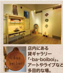
店内にある買ガラリー「ba-boibo」。アートやライブなど多目的な場。

「チャリンチャリン」扉を開くと、どこか懐かしさを感じる空間。「いろんな人に来てもらいたい。気軽に遊びに来て欲しいです。」とオーナーのKさん。お茶を楽しむついでに、店内のインテリアのセンスも盗んじやいませ(笑)。