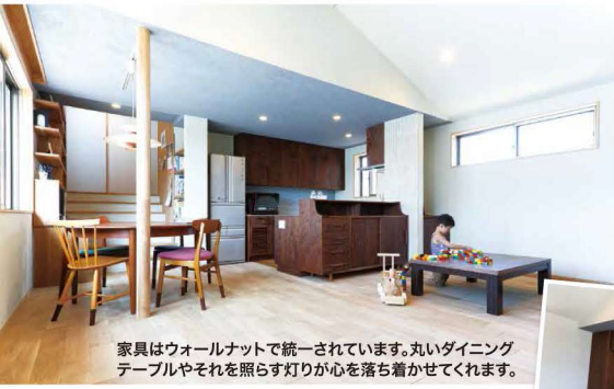
家具はウォールナットで統一されています。丸いダイニングテーブルやそれを照らす灯りが心を落ち着かせてくれます。

「コチに掲載された「北欧スタイルの家」の見学会を見に行ったとき、施主の奥さまが自ら「こちはこうなんですよ。こっちはね。」と幸せそうに案内してくれたのが印象的で、ユトリオさんのマイホーム計画がスタート。色々考えた末、ご実家の理容院の2階をリノベーションすることにしました。