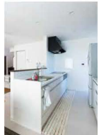
さわやかで清潔感のある、白いキッチン。気遣いは、ご夫婦の愛情のあらわれですね。

この不思議な光冷暖を松小田展示場でも体感できます。詳しくはカワサキホームさんまでお問い合わせください。