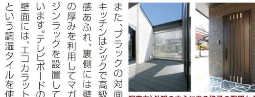
写真左）外観の中心にある格子の隙間から覗く、中庭のウッドデッキ。開放的な空間。

（お知らせ） この物件の際に出来た新しいモデルハウスで8/30(土)・31(日)にオープンハウス実施します。