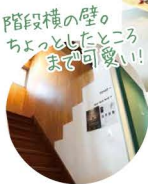
階段横の壁の壁紙を剥がして、塗り替えました。

壁は黒板塗料を塗り、その日のおすすめメニューやイラストが描かれています。今回は、鈴木浩介建築設計事務所とのデザイン、金剛住機(株)の協力・施工指導のもと、予算をかけるに手間暇かけた、ボランテアスタッフによるセルフリノベーションです。