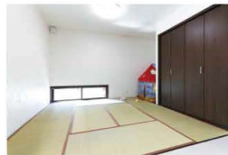
モダンな印象の和室。

切ですね! H邸の壁は、すべて光冷暖専用の漆喰の塗り壁。湿度調節もしてくれるので、カラッとすいていて暑く感じません。消臭効果もあり一石二鳥です。また、キッチン、洗面・お風呂と水回りをまとめて