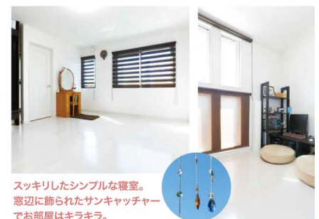
スッキリしたシンプルな寝室。窓辺に飾られたサンキャッチャーで部屋はキラキラ。