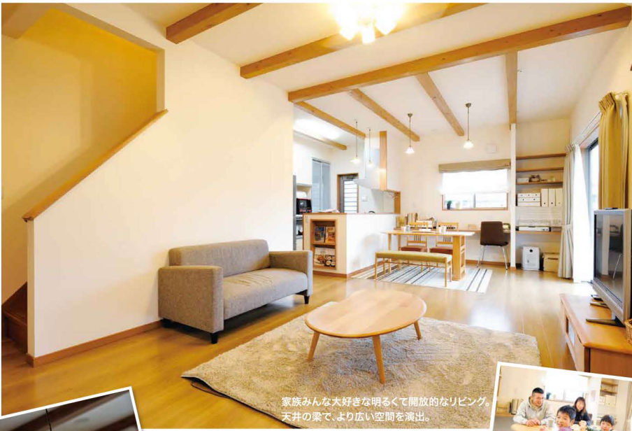
家族みんな大好きな明るくて開放的なリビング。 天井の梁で、より広い空間を演出。

澄んだ冬空に映えるシンプルなお家。 佐賀の実家のようなのどかなところで暮らしたいという思いから、 四季を楽しめるマイホームが実現しました。