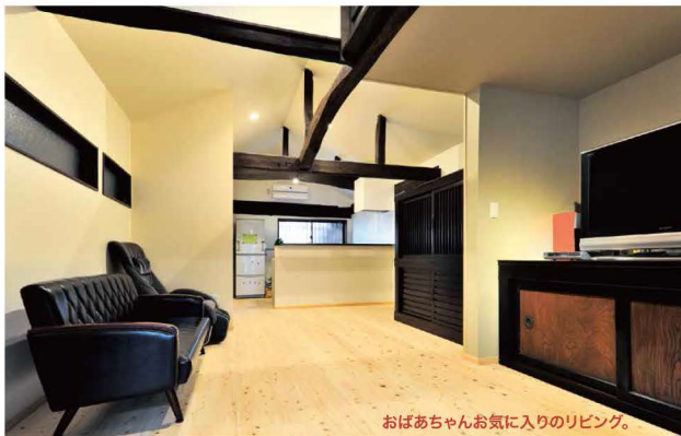
おぼあちゃんお気に入りのリビング。