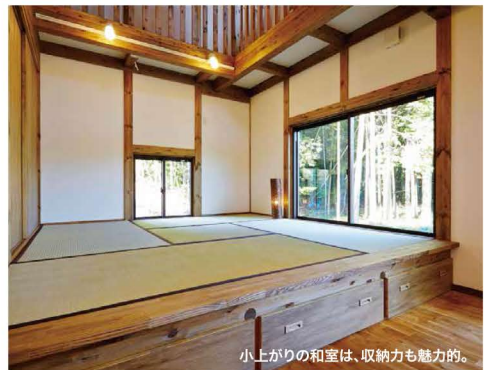
小上がりの和室は、収納力も魅力的。

こちらのお家はお施主様のご厚意でモデルルームとして見学出来ます。詳しくはお問い合わせください。