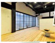
土間の台所が温もりのあるキッチンへ。