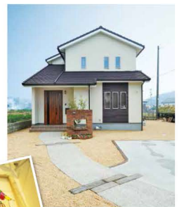
白くてシンプルな外観。アクセントの木目調パネルとレンガ調の門柱が印象的。