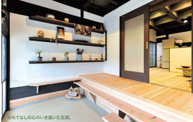
おもてなしの心のいき届いた玄関。

暗かった玄関は古い建具を再利用しコストも抑えて、光が差し込む明るい空間に。通り土間は床を上げてダイニングキッチンに、二度外に出ないといけなかったトイレと浴室もLDKからバリアフリーで