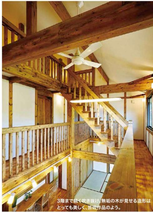
3階まで続く吹き抜け、無垢の木が見せる造形はとっても美しく、芸術作品のよう。