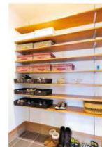
洗面・トイレがすぐ隣にあるシューズクローカー。学校から帰ったお子様たちの手洗いうがいがもパッチリです。

は、第2の玄関ともいえる広めのシューズクローカーがあり、ご家族専用の出入り口になっています。 開放感溢れるリビングは、大きな窓から光が差し込み、エアコンなしでもふんわりと温かさを感じます。シンプルな白い空間に木の優しさが伝わってくるココロ良い場所。みんなこが大好きです。 子どもたちの様子を伺える対面キッチン。側面にはマガジンラック、パントリーや収納もあり奥さま大助かり。「片づけ上手なんです。」ご主人をチャリリ。助かるのは、ご主人さんだ!