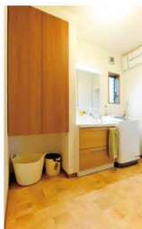
スッキリと収納された清潔なサニタリー。小物もシンプルで統一。