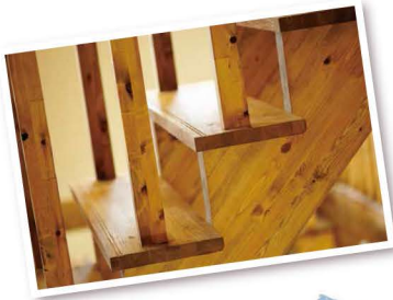
無垢材は、ナチュラルからダークまで色合いがセレクトできます。