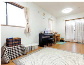
2F 子ども部屋。将来は2つに分けられるようにクローゼットも扉も2つあります。