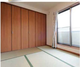
「寝るなら、畳!」とご主人。ベッドがない分、ゆったりとくつろげます。