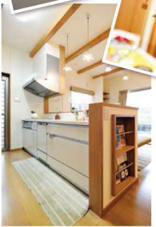
綺麗に片づけられた玄関の奥に