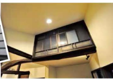
中2階の収納。元は壁だったところに窓を再利用。風通しもよく、朝日が差し込みます。

ちゃんには負担がかりすぎるといってお嫁さんからの配慮でリノベーションを考えました。どのようにするかは、ほはお任せ。「任せてたら間違いない。」とおぼあちゃん。寒さ対策は屋根と床下に断熱材を入れ、床材は無垢のひのきを使っています。寒かった土間は温かいキッチンとリビングに姿を変え、80年間も天井裏に隠れていた梁を見せ、室内に迫力を与えています。捨てるしかないかと考えていたお姑さんの年代物の嫁入箆、水屋は、手直しをして置くようにデザインされています。この姿におぼあちゃんも「もう本当に思いがけない空間だね!」と大喜び。その笑顔こそが木村さんのパワースourceとなつていこうね。手作りのたくあんをお土産に温かい気持ちで下関に帰りました。