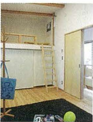
寝室と子ども部屋を繋ぐロフトは子どもたちのお気に入り。

このお家には、落葉樹が植えられたセンターホール「光庭」があります。これは周辺がアパートやマンションで囲まれている家の問題を解決するアイデア。外からの視線を遮り、自然光と風を程よく取り込むことができます。