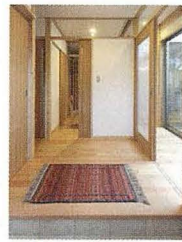
お家の中は木の香りに包まれています。