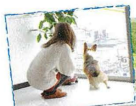
ここからの眺めは 毎日見ても飽きません。