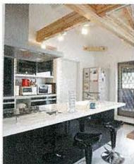
モントーンでコーディネート。 食器棚もキッチンに合わせて オーダー。

さて、気になるキッチン是对面 型のオープンキッチン! 収納を全 て壁面にもっていき、広めのパン トリーもあります。やっぱり、キッ チンはシンプルが一番!