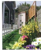
たくさんの花々が色鮮やかに お出迎え。