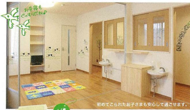
初めてこれられたお子さまも安心して過ごせます。