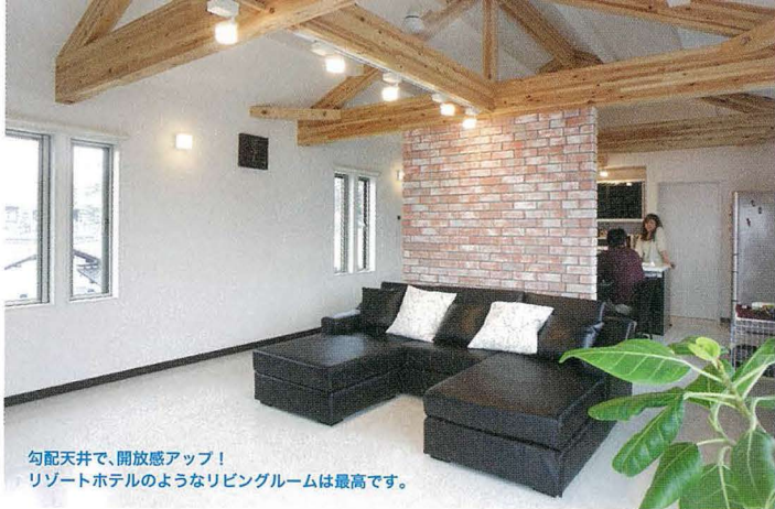
勾配天井で、開放感アップ! リゾートホテルのようなリビングルームは最高です。

約28畳のLDKは、お部屋中央 のつい立壁でリビングとダイニン グの仕切りになっています。ダイ ニング側の壁は、モダンなドット 柄でお洒落なカフェを思わせる空 間。リビング側はレンガをうめ込 み落ち着ける空間に。大好きな映