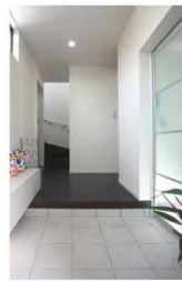
白を基調としたお洒落な 玄関ホール

「仕事ですんだら早く家に帰り たくなる。」と御主人。住みごち のよい暮らしはもうすぐ生まれて くるお子さまと一緒にもっと素敵に 変化していくことですね。」