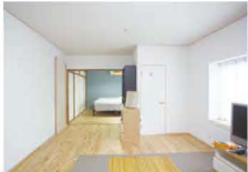
2Fは見晴らしが良く、海が見えます。ご夫婦で一杯飲むにも最高の場所です。

Y邸は玄関の扉を開けるとナチュラルカントリー系の雰囲気。壁にはめ込まれたチエッカーガラスがとってもお洒落！お部屋の中の温かい空気感が伝わってきます。次の扉を開くと、家具のようなキッチンが目に入り飛込んで来ました。可愛すぎ！前回もご紹介した家具職人さんにオーダーで作ってもらったもの。使い勝手よさ、デザイン、どれをとってもいいことなし。キッチンの後方には広いパントリーもあり、とっても便利。家族みんなが集まる場所LD。そこは、一番長く過ごすところ。素材選びは重要です。床材はナラ、扉などの建具はブラックチェリー等を使っています。リビングの壁一面の大きな窓は、お庭で遊んでいる子どもたちを見ながら家事ができる奥さま大助かり。