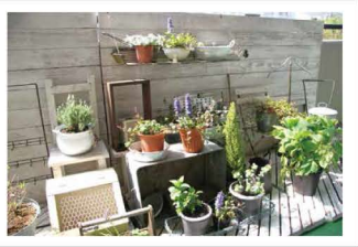
ベランダ マンションのベランダもこんなに素敵になります。小さな菜園もできます。

綺麗にガーデニングされた庭、ちよとした通りにプランターでかわいく花を植えているお宅を見かけると、「こちらまで温かい気分になります。」「やってみたいなあー」思っているがなかなか……と渋っているあなた!! 土いじりは意外にストレス解消になります。さあ、始めましょう。