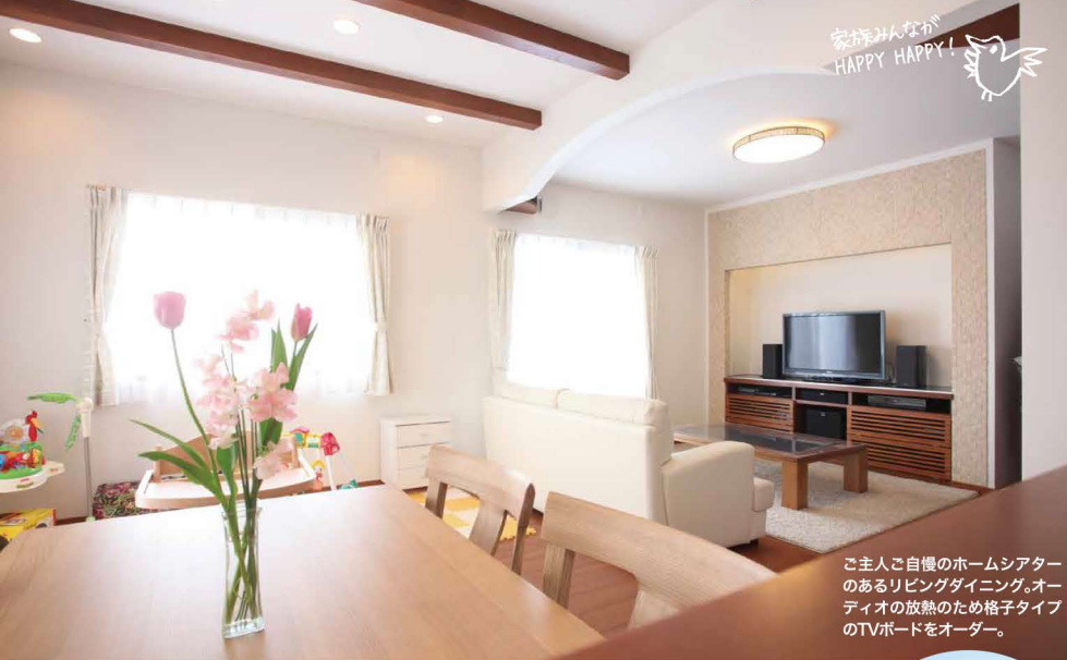
ご主人ご自慢のホームシアターのあるリビングダイニング。オーディオの放熱のため格子タイプのTVボードをオーダー。