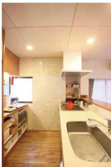
家具のようなオーダーキッチン。主婦のあこがれですね♪

以前は賃貸の戸建てにお住まいで、ユトリオさんいわく「古民家のギャラリーのようなお家でしたよ。」その時から奥さまのセンスが光ってたんですね。センスだけではなく、2児のママとしても頑張っています。パン作りも得意なんですよ！スタンプ一同ご馳走になっちゃいました。あまりの美味しさに思わず完食。