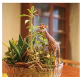
雑貨屋tobiusagiさんから購入

Y邸の家づくりは家族一緒にお手伝いしたそうです。床の塗装や珪藻土塗。ボクちゃんたちも楽しんでに違いありません。2生のいい思い出になりましたよ。ご夫婦。「家づくりが始まる前に、手描きのこんな家にしたいなメモを渡されました。それを見て、夢を形にする仕事をするんだなあ。てシーズンときました。」とユトリオさん。この言葉に私まで感動しちゃいました。こうやって温かい家づくりが出来ていくんですね。 ここでうれしいお知らせです。5月27日(日)にこちらのリフォーム見学会があるそうです。この機会にこのおうちカフェのような空間を楽しんでみて下さい。