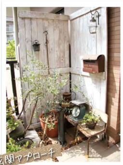
玄関アプローチ 白い木製の仕切り板など工夫いっぱいのアプローチ。玄関はお家の顔です。