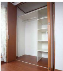
可動式棚付きのクローゼット。整理整頓もバッチリ!

外からのデザイン性も◎そして、大きなメイン窓からは、海映花火も見えるかも!夏が楽しみです。子ども部屋は広々♪書斎、将来は、お部屋を2つに分けられます。もちろん、収納もたっぷりあります。最初で最後の家づくり。完成したオウチは、快適過ぎて家から出たくないほど!開放感たっぷりのY邸は、ご家族の癒しの空間になっています。