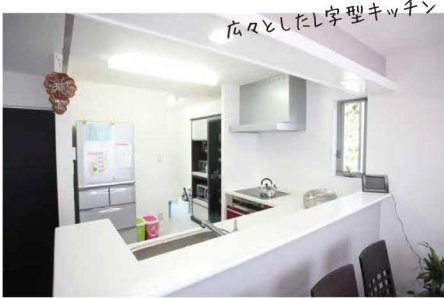
広々としたL字型キッチン

日の暴風雨もびたつとや んで、カラッと晴れた撮影 日です。完成して約5ヶ 月、静かな住宅街の角地に佇むM 邸はモノトーンに統一された外観、 外構のデザインでひと際目をひき ました。玄関アプローチの石畳も素 敵な雰囲気です。玄関は焼杉調フ ロアのこげ茶に真つ白な壁、すりカ ラスの奥は、たつぷりとしたシューズ クロークと、まるでホテルのよう です。リビングもモノトーンに統一さ れ広いウッドデッキがさらに空間を 繋げています。