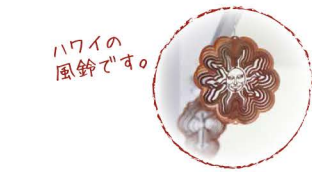
ハワイの 風鈴です。