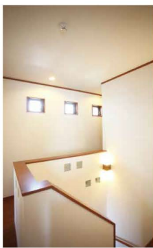
暗くなりがちの階段ホールも突き出し窓でやさしい光が差し込みます。外観からはアクセントになりとてもお洒落。