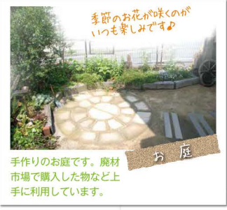
季節のお花が咲くのがいつも楽しみです。 お庭 手作りのお庭です。廃材市場で購入した物など上手に利用しています。

綺麗にガーデニングされた庭、ちよとした通りにプランターでかわいく花を植えているお宅を見かけると、「こちらまで温かい気分になります。」「やってみたいなあー」思っているがなかなか……と渋っているあなた!! 土いじりは意外にストレス解消になります。さあ、始めましょう。