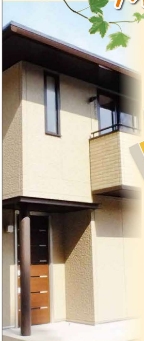
●外観写真は2号地のもです。H24年4月12日撮影