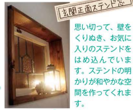
玄関正面ステンド窓

思い切って、壁をくりぬぎ、お気に入りのステンドをはめ込んでいます。ステンドの明かりが和やかな空間を作ってくれます。