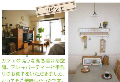
カフェのような落ち着ける空間。フレイバーパーティーと手作りのお菓子をいただきました。とっても、美味しかったです。

白い木製の仕切り板は、ご主人に作ってもらったのだそう。お部屋の中ものぞいて見たくなる空間です。