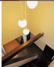
玄関の吹き抜け部分。梁と照明のバランスが空間を演出しています。