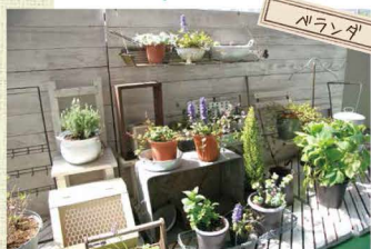
マンションのベランダもMさんの手にかかれば、こんなに素敵になります。後の壁は、ご主人作。小さな菜園もできます。

みなさんのまわりの素敵な家を ご紹介して下さいの 待ってま〜すの (ココチ編集部まで)