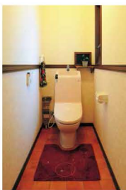
テラコッタタイルのトイレ。シンプルにまとめてあります。