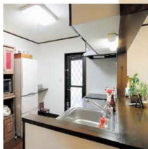
便利な対面キッチン。カウンターもお洒落に飾っています。勝手口もあるのでゴミ出しもラク。