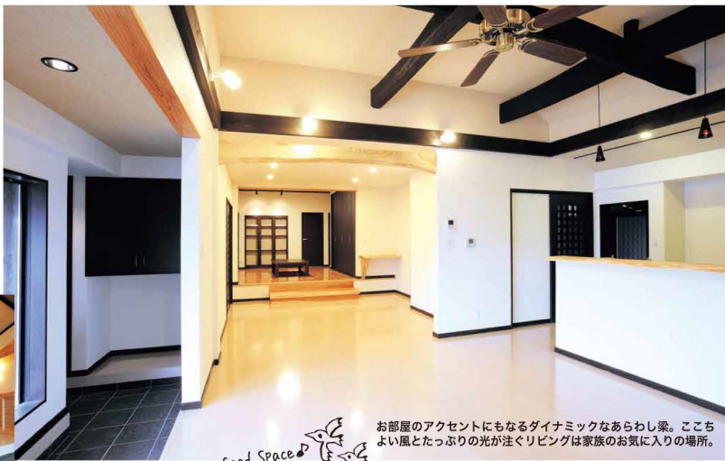
お部屋のアクセントにもなるダイナミックならわし梁。こころよい風とたっぷりの光が注ぐリビングは家族のお気に入りの場所。

株式会社 下関ハウジング 〒751-0883 下関市田倉755番地 http://shimonoseki-housing.co.jp/ お問合せはコチラ TEL083-256-5361