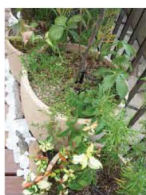
全ての鉢の中には自動 スプリンクラーを設置。 面倒な水やりも不要。

見た目のデザインと、しっかりと した機能を兼ね揃えたリフォーム は、想像をはるかに越えた完成度 の高いものになっていきます。