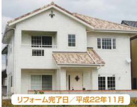
リフォーム完了日/平成22年11月

リフォーム内容 ・クロス部貼替・畳表替 ・全室照明器具付・エアコン新設 ・ハウスクリーニング・白アリ予防工事