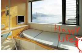
2階のリビングからも、お風呂からも一望できる関門海峡。

1階はご主人の要望を中心としたスペース。ホワイイトに赤をきかせた空間が湧いています。家族みんな大満足♪ My Favorites