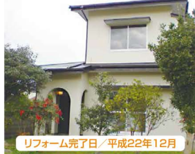
リフォーム完了日/平成22年12月

リフォーム内容 ・畳替・フローリング部貼替 ・クロス部貼替・システムキッチン新設 ・外壁全塗装・全室照明器具付 ・TVドアホン新設・白アリ予防工事 ・ハウスクリーニング