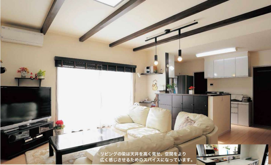
リビングの梁は天井を高く見せ、空間をより広く感じさせるためのスパイスになっています。