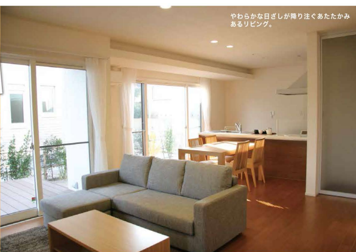
やわらかな日差しが降り注ぐあたたかみあるリビング。