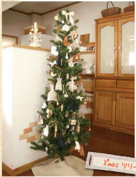
取材ということで昨夜準備してくれました。手作りオーナメントのツリーです。