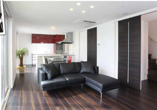
check! 光と風を感じる開放的なリビング。夜はダーク系でコーディネートされた落ち着いた空間へ。