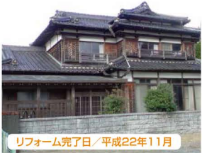
リフォーム完了日/平成22年11月

土地 1,133.81㎡ 342坪 建物 240.08㎡ 72坪 駐車 4台 9DK 2,280万円 (税込)