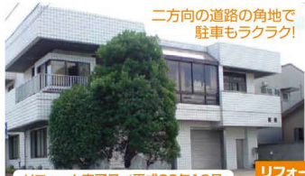
リフォーム完了日/平成22年10月

土地 358.02㎡ 108坪 建物 336.53㎡ 101坪 駐車 4台 4DK 3,000万円 (税込)