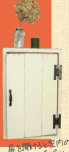
扉を開けると室内の電気スイッチが...