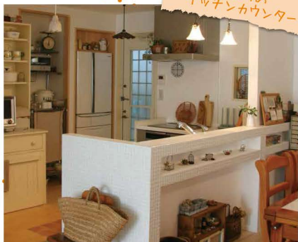
タイル貼りのキッチンカウンター