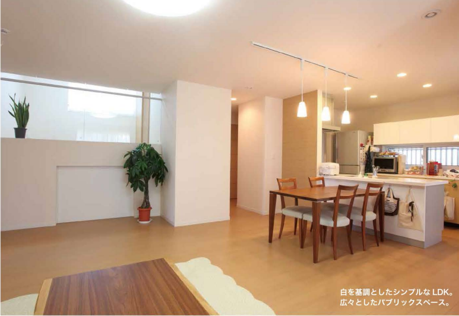
白を基調としたシンプルなLDK。 広々としたパブリックスペース。