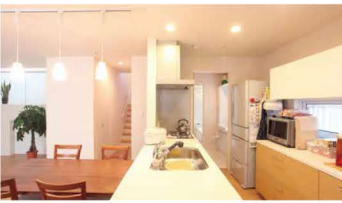
明るい対面キッチン