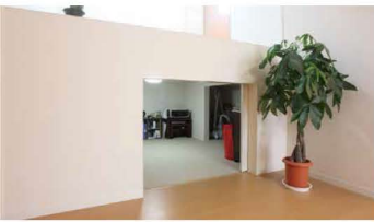
大収納空間「蔵」ソファやテーブルも そのまましまえるくらい広め

「これが蔵なんです。」想像し てたものよりも、はるかに大きな 収納スペース！この上が1.5階、タ タミルームです。趣味室やゲス トルームにぴったり。さらに0.5 階上がると、ご夫婦の寝室です。 勾配天井でのびのび過ごすこと ができます。また、ここにも2階 の「蔵」があります。そして、空 にいちばん近い、2.5階のお部屋。 収納スペースもたっぷりあります。 初めて見る「蔵の家」。まるで、 4階建の家のような不思議な感覚で した。「蔵」をつくることで、限 られたスペースをさらに有効的に使 える。そんな、知恵と工夫がいっぱ いの住まいはライフスタイルに合わ せてこれからも成長していきます。