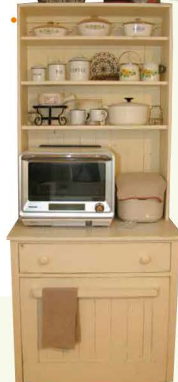
キッチンシェルフ