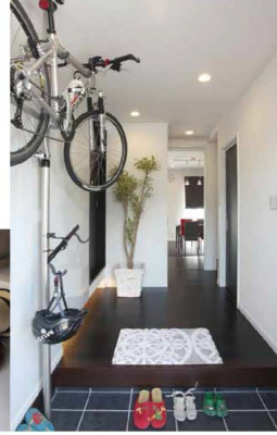
サイクリングの好きなご主人。玄関の自転車と壁一面の帽子がオシャレ。