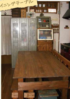
ダイニングテーブル