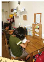
子ども達の学習机

ダイニングテーブルや飾り棚、 学習机までご主人手作りの作品。 どれも温かみのある家具 たちです。幼稚園のバザーの 出展がきっかけで、作り始め たそうです。