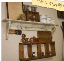
リビングの飾り棚