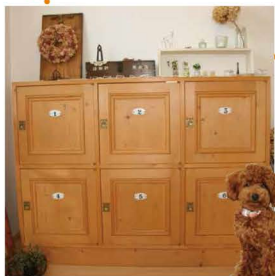
壁木の「トルちゃん」