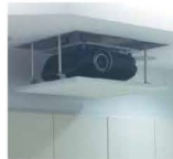
◀天井に取付けたプロジェクター(昇降時)使わない時は天井内に収納されます。