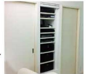
▶アンプやレコーダーなど10機以上の機器類を造作ラックに収納。スッキリした空間を保てます。