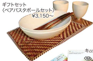
ギフトセット (ペアバスタボールセット) ¥3,150~