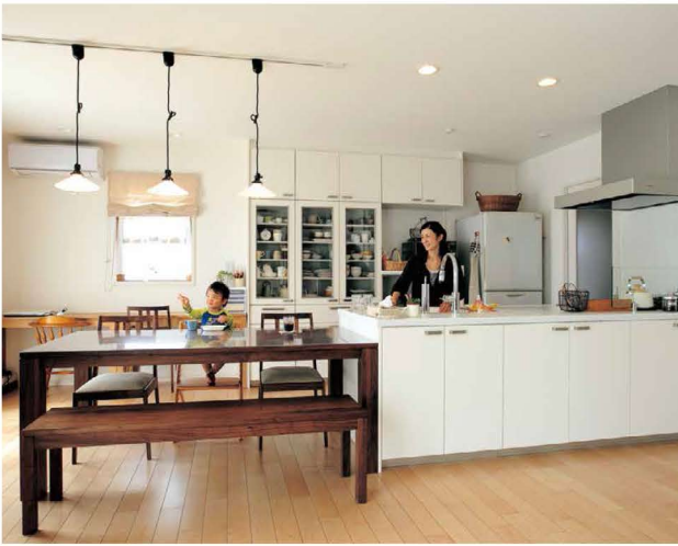
キッチンに立つとお部屋全体が見わたせ奥さまも安心。