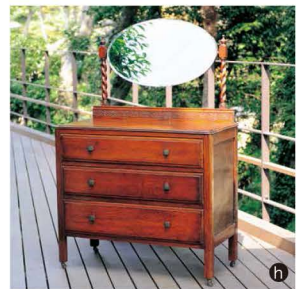
a.4灯シャンデリア(1920~1930年頃)ノバルディ・ジーン作 400,000円 b.クリスタルガラスドアノブ 32,000円(前) c.真鍮無垢のドアノブ 27,000円(奥) d.ステンドグラス(1930年頃)イギリス 45,000円 e.天使シャンデリア(1890~1900年頃)フランス 300,000円 f.弊社はロイドルーム家具のラスティーズ・ロンドン正規代理店です。g.薪ストーブ(1979年)パーモントキャストイング社製 550,000円 h.ドレッサーボード(1930年頃)イギリス 133,000円